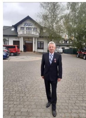
Opracował: Zbigniew Stefaniec Sekretarz Koła Świdnik